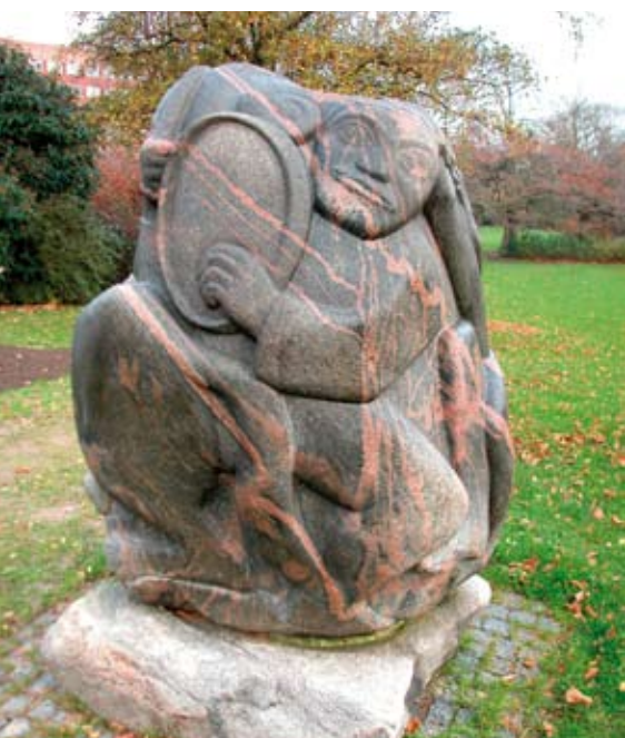
Også Heerup er rigt repræsenteret på Bispebjerg Hospital.