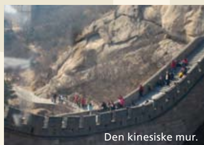
Den kinesiske mur.