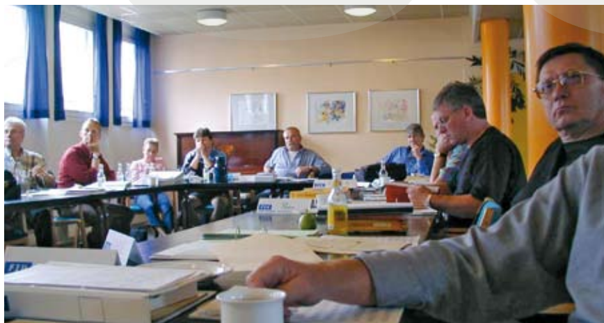
Fra et tidligere grundkursus i FOA 1. Der lyttes interesseret!