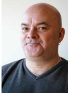
Af Jesper Hesselholdt, faglig sekretær i FOA 1