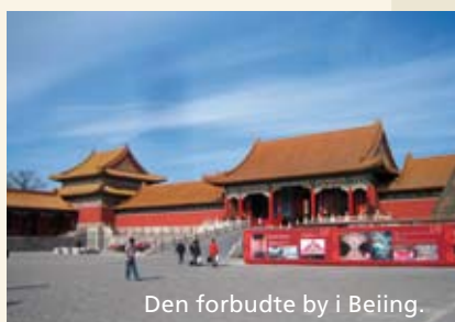
Den forbudte by i Beijing.