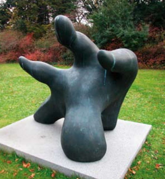
Ejler Billes "Figur med fangarme". Skænket af Ny Carlsbergfondet til Bispebjerg Hospital i 2003 i anledning af hospitalets 90 års fødselsdag.